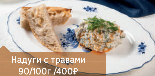
Надуги с травами 90/100г / 400₽