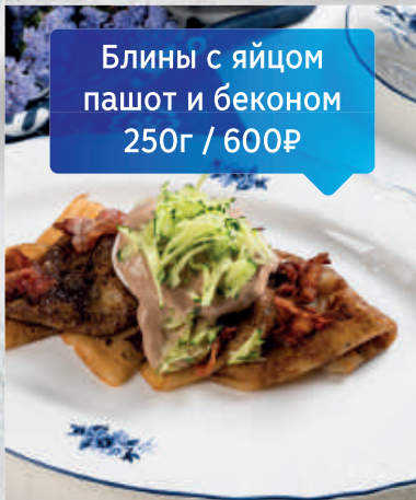
Блины с яйцом пашот и беконом 250г / 600₽