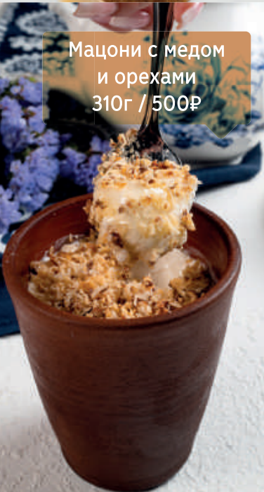
Мацони с медом и орехами 310г / 500₽