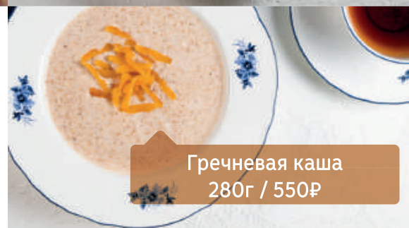
Гречневая каша 280г / 550₽