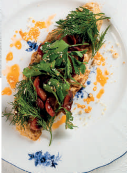
Омлет с охотничьими колбасками / 180г / 500₽