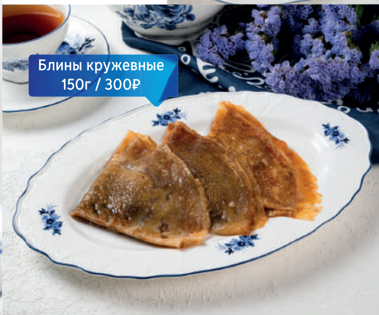
Блины кружевные 150г / 300₽