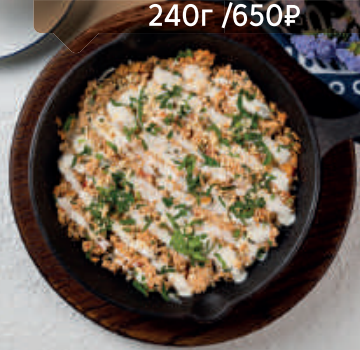
Яичница Чиж-бижи 240г / 650₽