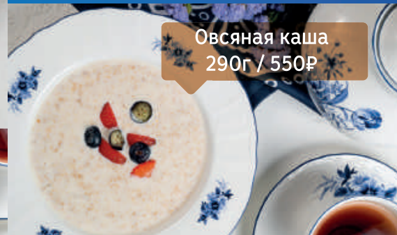
Овсяная каша 290г / 550₽