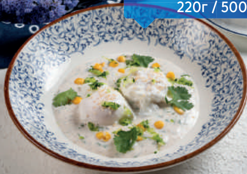
Яичница по-батумски 220г / 500₽