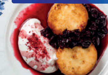
Сырники с вишневым соусом и сметаной 180г / 600₽